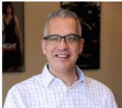
艾文·贝拉得杰 Irving Belateche

南加大最受好评的编剧老师、编剧、作家。他不仅为顶尖电影制作公司如派拉蒙、索尼、华纳兄弟和电视网络如 HBO, Syfy (NBC 奇幻频道)撰写剧本，也是畅销书《爱因斯坦的秘密》和《H2O》的作者。他的十七部已售出的长片剧本中包括《极品飞车》《完美孕期》等。曾合作过的知名制作人和导演包括劳伦斯·班德(《低俗小说》)、乔·西韦尔(《骇客帝国》)、罗伯特·伊万斯(《罗斯玛丽的婴儿》)、杰森·布鲁姆(《爆裂鼓手》、《鬼影实录》)、罗伯特·泽米吉斯(《阿甘正传》、《回到未来》)、罗兰·艾默里奇(《独立日》)等。