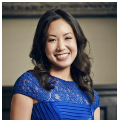
翠怀恩·农 Chantal Nong

华纳 DC 副总裁，曾任华纳影业副总裁多年，主导制作的电影包括《巨齿鲨》、《摘金奇缘》、新《哥斯拉》系列、《300 勇士：帝国崛起》、《实习生》等。