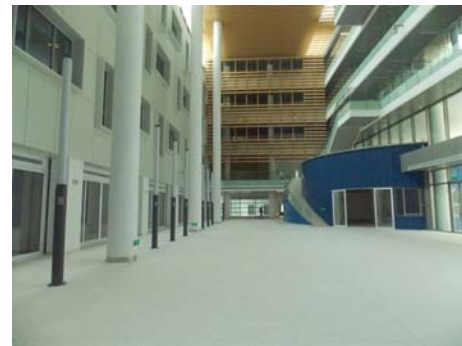
↑ 信息 E-1(a)区 中庭

信息学院（一期）E-1(a)、(b)、(c)、(d)区和 E-2 楼，物质学院（一期）C-1(a)、(b)、(c)、(d)区和 C-2(a)区，分别于 2016 年 5 月 18 日、6 月 1 日通过竣工验收。