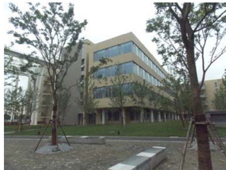
↑ 图 信息 E-1(d)区