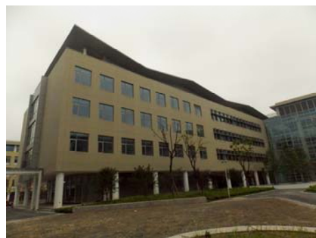
↑ 图 物质 C-1(b)区