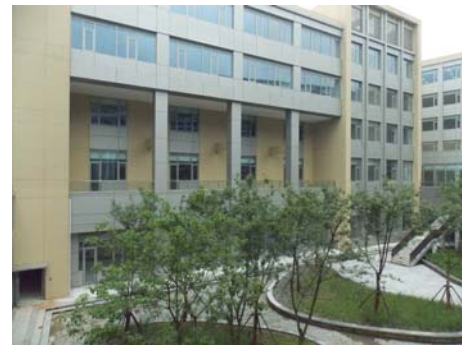
↑ 图 信息 E-1(b)区