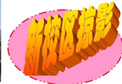
→ 图 图书馆中庭