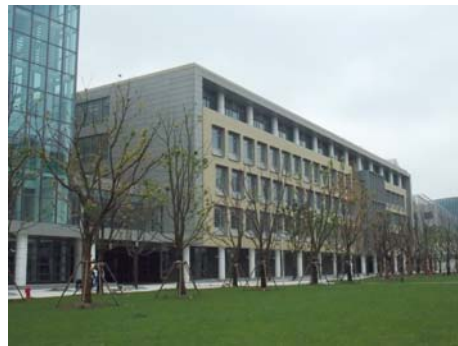
↑ 图 信息 E-1(c)区