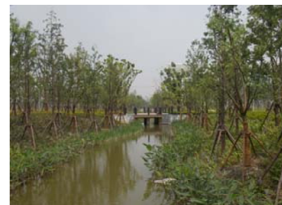
↑ 图 景观一、二、三分区河道