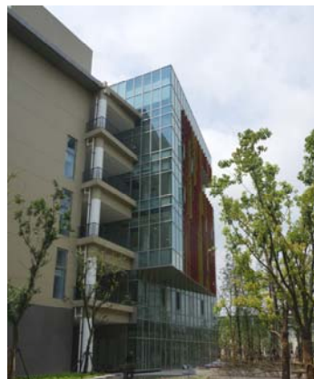
↑ 图 物质 C-1(g)区