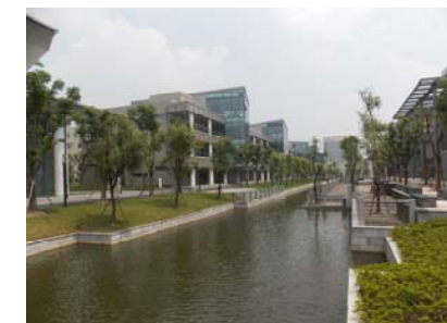
↑ 图 景观八、九分区河道