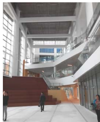
↑ 图 物质 C-1(a)区 中庭