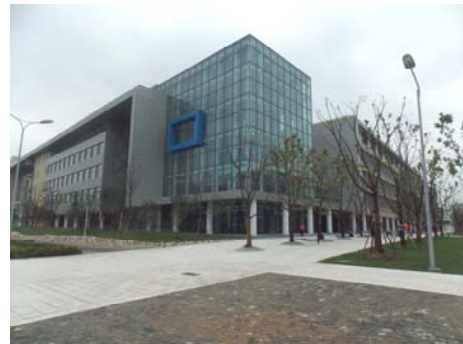
↑ 图 信息 E-2 楼