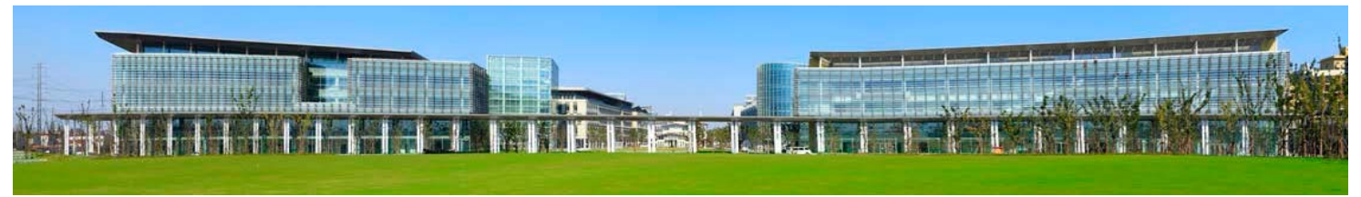
↑ 图 新校区南立面