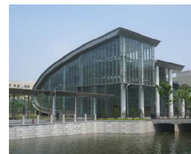
↑ 图 报告厅 ← 图 物质学院交互空间