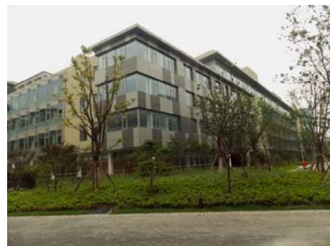
↑ 图 物质 C-1(d)区