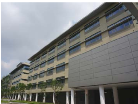
↑ 图 物质 C-2(a)区