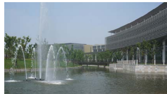
↑ 图 景观七分区水景