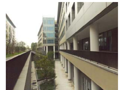
↑ 图 物质学院 d 区下沉式广场