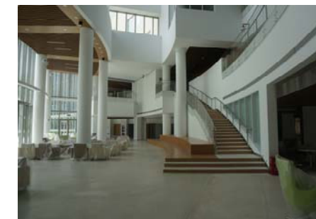
↑ 图 创管学院 中庭