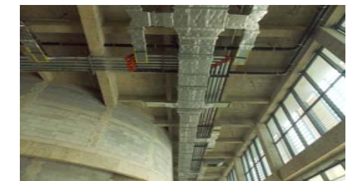
↓ 图 国际交流中心报告厅前室上方管道

国际交流中心： 幕墙北立面窗框柱陶板安装。裙楼一层前厅地坪找平层细石混凝土浇筑，一层游泳馆走廊吊顶施工，二层会议室墙面轻钢龙骨及吊顶安装。