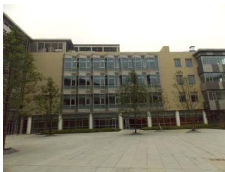
↑ 图 物质 C-1(c)区