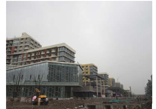
↑ 图 学生中心、研究生宿舍楼、食堂

本科生宿舍 ：3号楼基本竣工。 专家公寓及教室宿舍 ：1--6号楼室内装饰收尾，室外台阶坡道面层铺装。 研究生宿舍 ：1—6号楼底层吊顶封石膏板，卫生间铺贴墙地砖，室内墙面打磨、喷涂料，走道踢脚线贴砖；7号楼内装收尾。 1~3号食堂 ：1号食堂地下室汽车坡道浇筑砼，2、3号食堂室内吊顶施工、墙面装饰板安装。 体育馆 ：东看台外墙仿清水混凝土施工，室内墙面吸音棉、木质吸音板安装。 学生中心 ：外幕墙水泥板安装，室内吊顶铝合金格栅安装，发光塔幕墙钢架安装。 体育场 ：排水沟施工，场地平整。