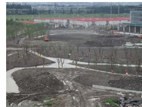
→ 图 大门入口区域景观施工

桥梁结构施工完成 13 座。规一路、规三路侧石铺装，景观河道施工。师生生活区、创艺学院西侧、创管学院西南区域、大门入口区域苗木种植和景观道路施工。