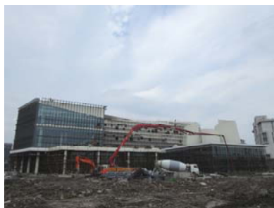
↑ 图 图书馆

物质学院 ：C-1 区室内吊顶龙骨安装，设备间施工；C-2 设备间施工，外幕墙龙骨安装。二期：C-1 (g、f) 区屋面防水施工，外墙保温施工；C-2 (b) 楼、C-3 楼内外装修开始。 信息学院 ：E-1 (a、b、c、d) 吊顶安装，铝合金窗框安装；E-2 吊顶龙骨安装，外墙保温施工。二期E-3、E-4楼外墙保温板铺贴，屋面防水卷材施工。 创管学院 ：室内墙地砖铺贴，吊顶安装；外墙铝合金百叶安装；电缆、电线敷设。 创艺学院 ：B-1(a、b、c、d) 区墙体粉刷、外保温施工、室内吊顶安装；电缆、电线敷设。 生命学院 ：屋面防水卷材铺设，室内地坪浇筑，内外墙腻子批嵌，外墙保温施工，幕墙玻璃安装。 互动长廊 ：屋面玻璃安装。