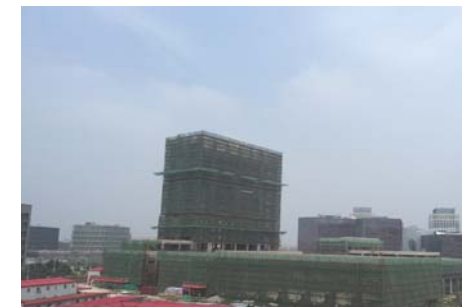
↑ 图 国际交流中心