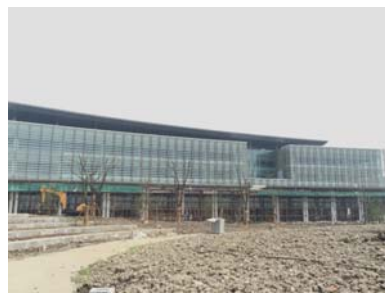
↑ 图 行政中心