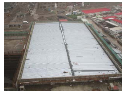
↑ 图 国际交流中心游泳馆屋盖