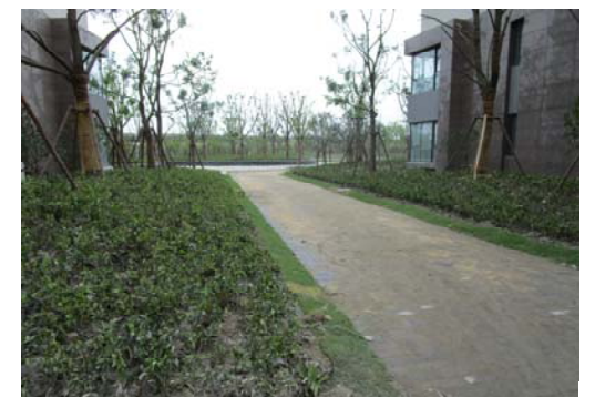
↑ 图 专家公寓及教师宿舍楼前景观

(施工概况据 2015 年 7 月 24 日统计资料)