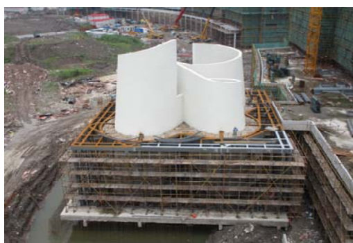
↑ 图 图书馆书卷楼