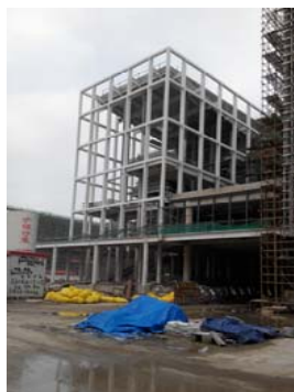
→ 图 信息学院

物质学院: C-1 区内墙粉刷, C-2 区二结构施工完成, 强、弱电穿线。二期: C-1 (g、f) 区内外墙粉刷, C-2 (b) 区1-4 层二结构施工, C-3 楼1-5 层二结构施工, 风管安装。 信息学院: E-1 (a、b、c、d) 区局部窗帘箱安装, 吊顶施工; E-2 区内外墙粉刷, 强、弱电穿线。二期: E-3 楼内外墙粉刷, 外墙保温板铺贴; E-4 楼粉刷准备, 屋面防水施工, 风管安装。 创管学院: 局部墙地砖铺贴, 幕墙玻璃、铝板安装, 强、弱电配管、穿线。 创艺学院: B-1(a)区粉刷施工, B-1(b)区墙地砖铺贴, B-1(c)区卫生间防水施工, B-1(d)区墙地砖铺贴, 幕墙玻璃、铝单板安装。 生命学院: L楼局部幕墙龙骨施工, 地下室局部墙面抹灰。二期: Y楼5-8 层二结构施工。 互动长廊: 钢结构涂装。