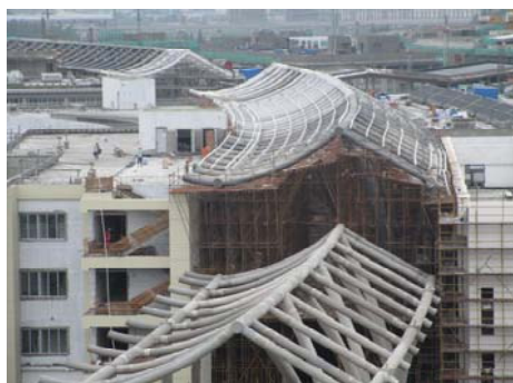
↑ 图 互动长廊