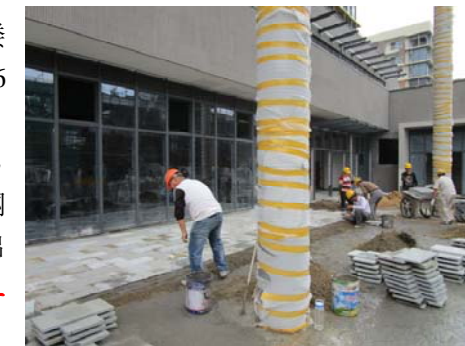
↑ 图 食堂室外地坪石材铺贴

本科生宿舍: 3号楼基本竣工。 专家公寓及教室宿舍: 1-6号楼室内装饰收尾, 1、2号楼消防喷淋管试压。 研究生宿舍: 1-6号楼室内墙面打磨, 进户门安装, 吊顶安装, 墙地砖铺贴; 7号楼自行车棚大理石墙面安装。 1~3号食堂: 水磨石地坪施工, 墙地砖铺贴; 地下室各配电箱进出线接线。 体育馆: 屋面彩钢面板安装, 外墙幕墙安装龙骨; 空调箱水管接管, 配电箱进出线接线, 走廊喷淋管开孔、支管安装, 桥架内电线放线。 学生中心: 室内吊顶安装, 外墙幕墙玻璃安装, 四层二结构施工。