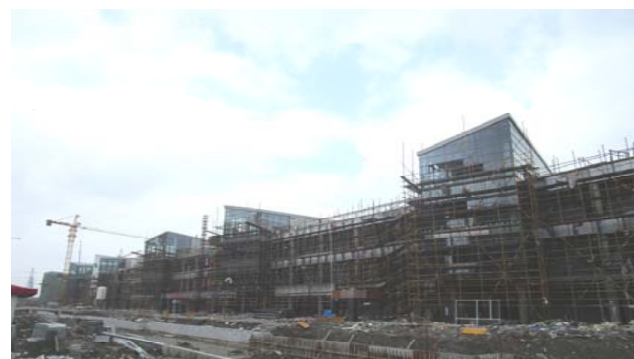
→ 图 H-1\ H-2 楼施工全貌

H-1 (a) 楼内外墙粉刷, H-1(b) 楼、H-2 楼外墙涂装, 吊顶龙骨安装, 屋面防水、保温施工; H1、H2 楼风管安装, 送、回水管, 消防水管加工、制作、支架安装。