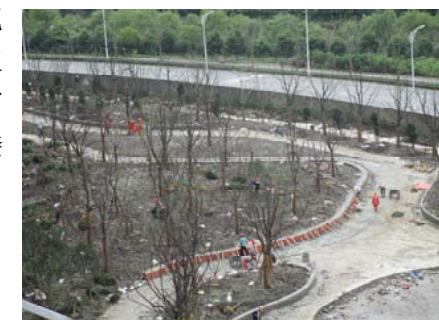
↑ 图 专家公寓及教师宿舍楼南侧绿化施工, 道路侧石铺装