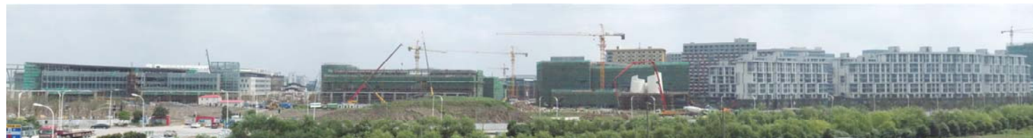
↑ 图 上科大工地全景 6月19日摄