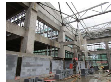
↑ 图 国际交流中心游泳馆区域二结构施工