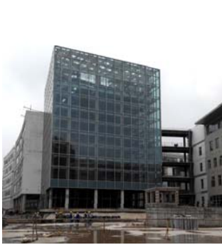
↑ 图 创艺学院 B-1(b)区