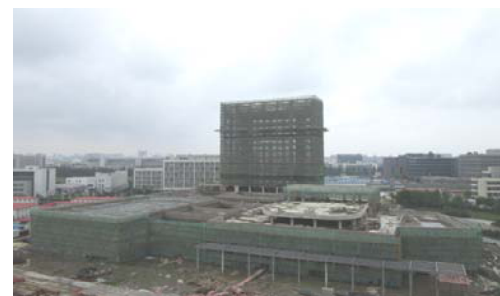
→ 图 国际交流中心施工全貌

国际交流中心: 国际交流中心裙楼二结构施工, 幕墙龙骨安装; 主楼二结构部分完成, 幕墙龙骨安装。