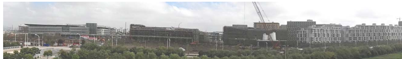
↑图 上科大工地全景 7月15日摄

H-1(a)楼内外墙粉刷, 外墙保温施工, 吊顶龙骨安装; H-1(b)楼、H-2楼外墙涂装, 吊顶安装, 地坪浇筑, 墙地砖铺贴, 风管安装; 送、回水管安装。