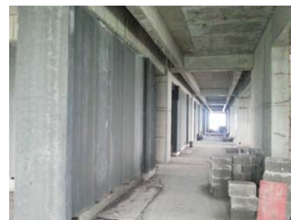
↑图 国际交流中心主楼室内隔墙条板