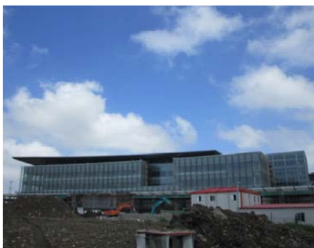
→图 行政中心南立面