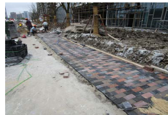
→图 学生中心北侧道路铺装

桥梁结构施工完成11座。规一路侧石铺装, 景观河道挖土。师生生活区、创艺学院西侧、创管学院区域、规一路南侧苗木种植和景观道路施工。