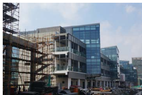
↑图 H 楼

图书馆: 外墙保温板施工, 内装隔断龙骨安装, 吊顶铝单板安装。 行政中心: 行政中心外墙保温板铺贴, 室内龙骨安装、窗百叶安装; 桥架安装, 配管。 公共教室: 公共教室A 区内外墙粉刷, 龙骨安装, B 区二结构施工。 行政办公楼: 装饰收尾。