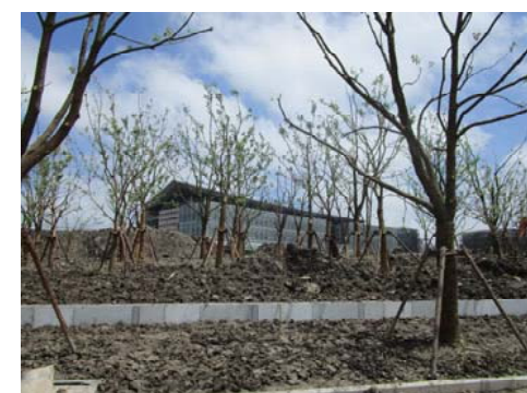
↑图 行政中心南侧景观绿化

(施工概况据2015年7月10日统计资料)