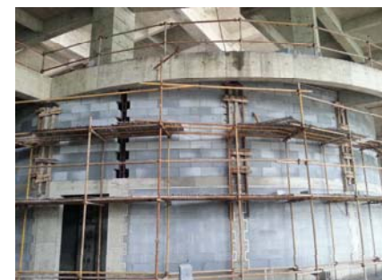
↑图 国际交流中心二结构施工