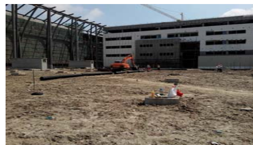
↑ 图 大地下室顶板覆土

(施工概况据 2015年5月22日统计资料)