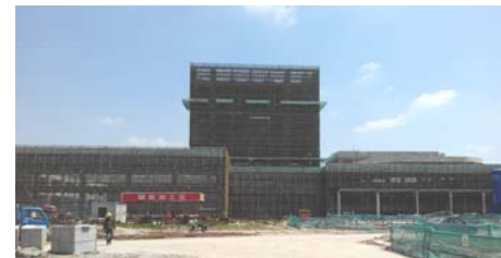
→ 图 国际交流中心