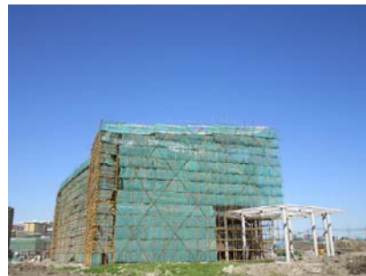
↑ 图 行政中心

本科生宿舍: 3号楼竣工收尾。 专家公寓及教室宿舍: 1-6号楼室内门扇安装, 木地板铺设, 卫生间、厨房吊顶安装。 研究生宿舍: 1-6号楼室内墙批腻子, 卫生、厨房间墙面砖铺贴等, 7号楼室内pvc地板铺设。 食堂: 1#、2#食堂地下室走道、卫生间墙地砖铺贴, 2、3号食堂吊顶龙骨安装。 体育馆: 幕墙龙骨安装, 墙面粉刷; 管道、桥架安装。 学生中心: 学生中心外墙幕墙龙骨安装, 发光塔钢结构立柱安装。