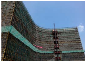
↑ 图 二期Y楼

物质学院: C-1 (b、c、d) 区内墙粉刷, 配管穿线, 电箱安装等; C-2 楼二结构施工。二期: C-1 (g) 区、C-1 (f) 区、C-2 (b) 区、C-3 楼二结构施工。 信息学院: E-1 (a、b、c、d) 区内、外墙粉刷, 配管穿线, 电箱安装等。二期E-3 楼外墙粉刷, E-4 楼1-5 层二结构施工。 创管学院: 局部吊顶龙骨安装, 地砖铺贴; 幕墙玻璃安装, 铝板安装; 强、弱电配管穿线等。 创艺学院: B-1 (b、d、c) 区内装施工, 部分区域幕墙玻璃安装等。 生命学院: 屋面防水卷材铺贴, 地下室局部地坪浇筑。二期Y 楼二结构施工。