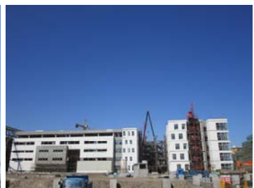
↑ 图 创艺学院