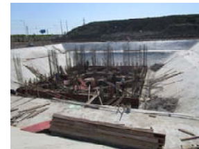
→ 图 塔楼基坑