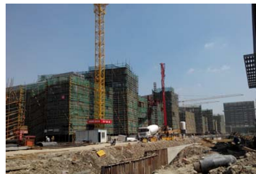
↓ 图 研究生宿舍7号楼南侧绿化施工

H-1 (A) 屋面浇筑完成, 2-3 层二结构施工; H-1 (B)、H-2 楼内墙粉刷, 外墙保温施工, 风管、桥架安装等。