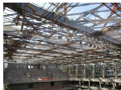
↑ 图 体育馆内部

本科生宿舍: 3号楼竣工收尾。 专家公寓及教室宿舍: 1-6号楼室内门扇安装, 木地板铺设, 卫生间、厨房吊顶安装。 研究生宿舍: 1-6号楼室内墙批腻子, 卫生、厨房间墙面砖铺贴等, 7号楼室内pvc地板铺设。 食堂: 1#、2#食堂地下室走道、卫生间墙地砖铺贴, 2、3号食堂吊顶龙骨安装。 体育馆: 幕墙龙骨安装, 墙面粉刷; 管道、桥架安装。 学生中心: 学生中心外墙幕墙龙骨安装, 发光塔钢结构立柱安装。