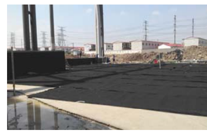
↑ 图 大地下室顶板滤水层