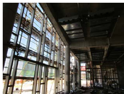
↑ 图 学生中心内部施工