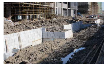
↑ 图 景观河道挡水墙

桥梁已动工 14 座, 结构施工完成 8 座。河道开挖近 700 多米, 驳岸施工 200 米。绿化苗木种植开始。大地下室顶板覆土近 30%。