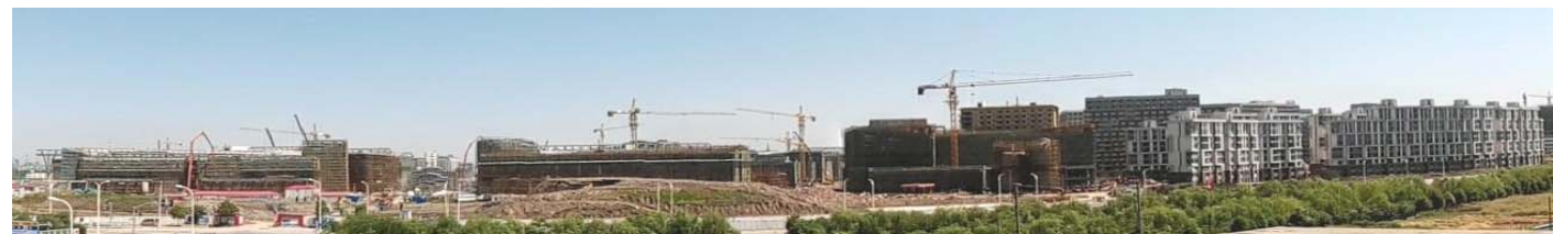
↑ 图 上科大全景 5月21日摄