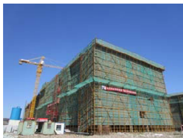
↑ 图 物质学院