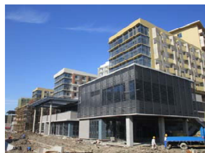
↑ 图 2号食堂