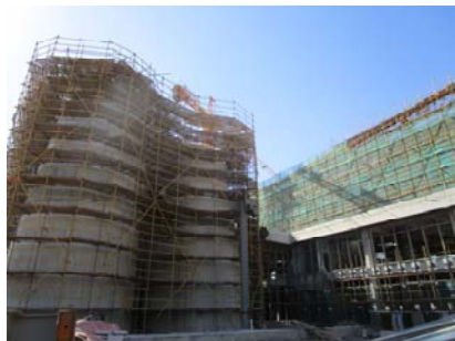
↑ 图 图书馆

图书馆: 外墙粉刷, 幕墙玻璃安装。 行政中心: 行政中心3-5 层二结构施工, 1-2 层内墙粉刷, 幕墙玻璃安装。 公共教室: 公共教室A 区、B 区结构施工。 行政办公楼: 屋面防水施工, 外墙保温板铺贴, 铝合金门窗框安装。