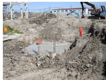
↑ 图 规二路1号桥承台