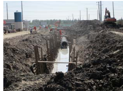
↑ 图 中科路西端雨水管