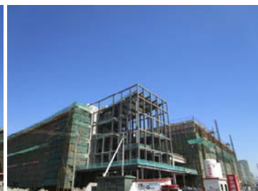
↑ 图 信息学院