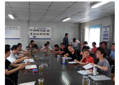
↑ 图 工程档案工作会议

7月8日上科大建设管理工程部召开“上科大工程档案工作会议”，专题讨论、研究工程归档资料的收集、整理、编制工作。