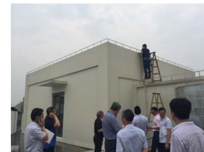
↑ 图 专家实地检查