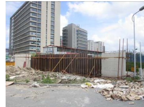
↑ 图 东大门施工