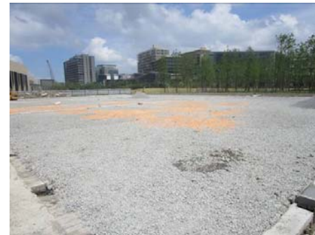
↑ 图 网球场施工