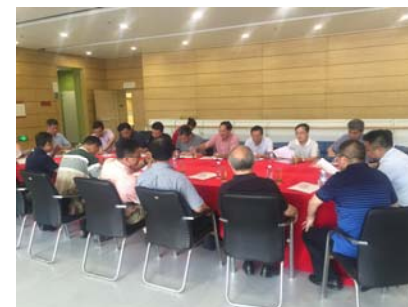
↑ 图 评审委员会专家讲评

上科大体育馆、图书馆两项工程获得“2015年度上海市优质工程（结构工程）”奖。上海建工将这两项工程申报为上海市建设工程“白玉兰”奖（市优质工程）。6月22日，评审委员会进行现场检查和讲评。