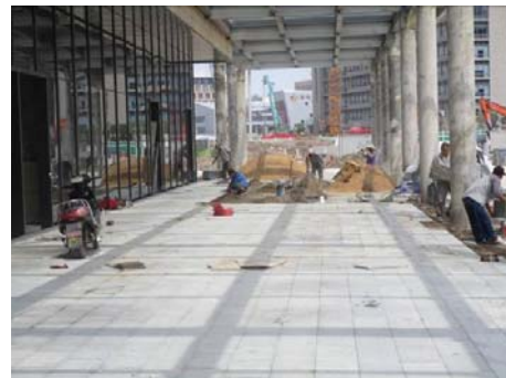
↑ 图 国际交流中心南则铺张

国际交流中心： 室外装饰：幕墙北面窗框柱、陶板及压条安装。裙房室内装饰：报告厅满堂脚手架搭设施工；前厅墙面龙骨安装；健身房半厅吊顶施工。室外总体：景观道路、铺张施工。