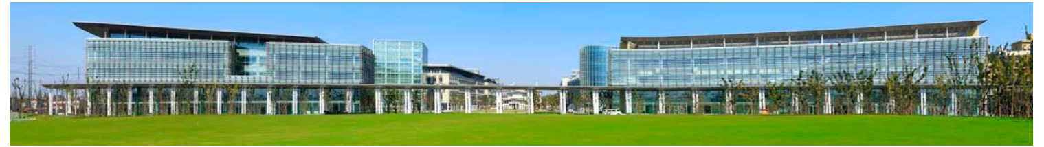
↑ 图 新校区南立面

会议明确了下一阶段的工作重点，还就设计和审图、施工和监理、档案管理和工程结算及学校二次装修项目急需办理单独报建等事项进行了讨论和部署。